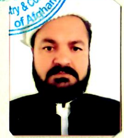
رئیس / President