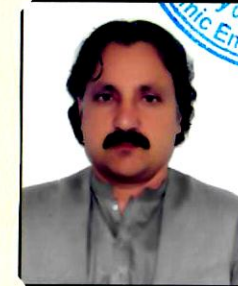
مرستیال / V-President

Jawhar Jawhar Construction & Road Building Company